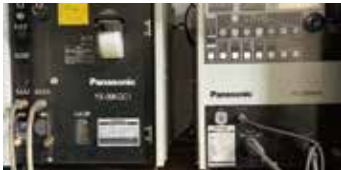
■ TIG 溶接機 ・ Panasonic YC-300BP4