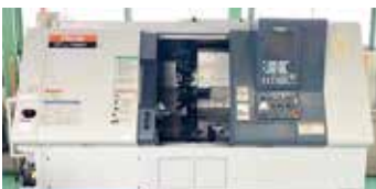
■ 複合NC旋盤 (Y軸あり) ・ MAZAK SQT-200MY