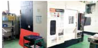
■ 5軸加工機 ・ MAZAK VARIAXIS 500-5X II