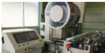
■ インモーションセンタ ・ サワイリエンジニアリング 長尺マシニングインデックス付き