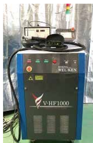
■ ファイバーレーザー溶接機 ・ WELKEN V-HF1000