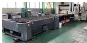
■ CO 2 レーザー加工機 ・ 三菱 4KW 40CF-R