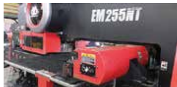
■ タレットパンチプレス機 ・ AMADA EM255NT 25t