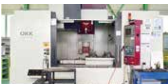
■ 立型 マシニングセンタ ・ OKK VM7III