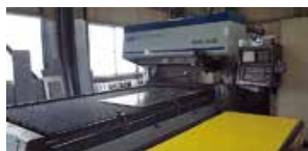
■ CO 2 レーザー加工機 ・ KOMATSU TLV-510