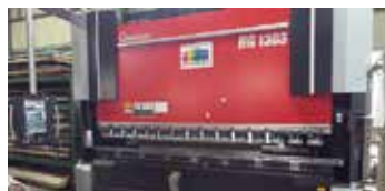
■ 油圧式バンダープレス機 ・ AMADA HG1303